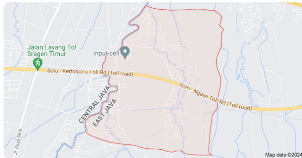
Kedungharjo Mantingan, Ngawi Regency, East Java