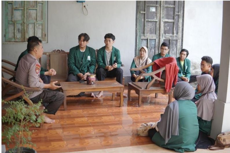
Gambar 7. Pertemuan Dengan Ketua RT 03 Dukuh Sembungan