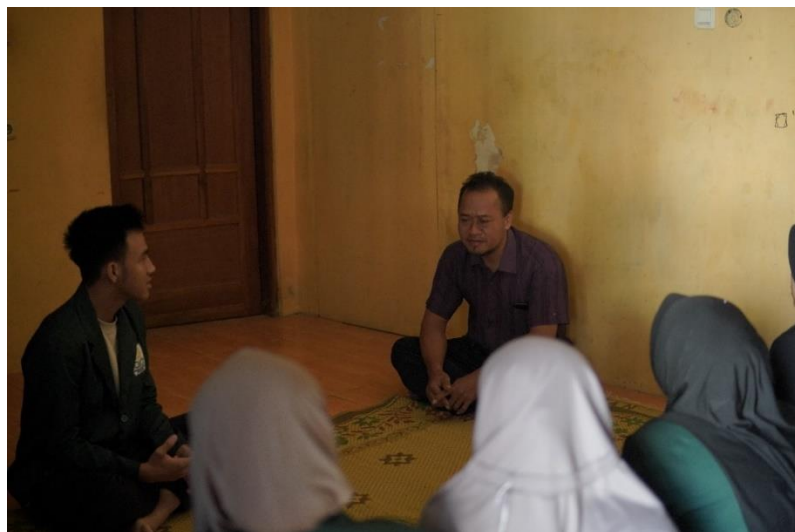
Gambar 9. Pertemuan Dengan Ketua RT 05 Dukuh Sembungan