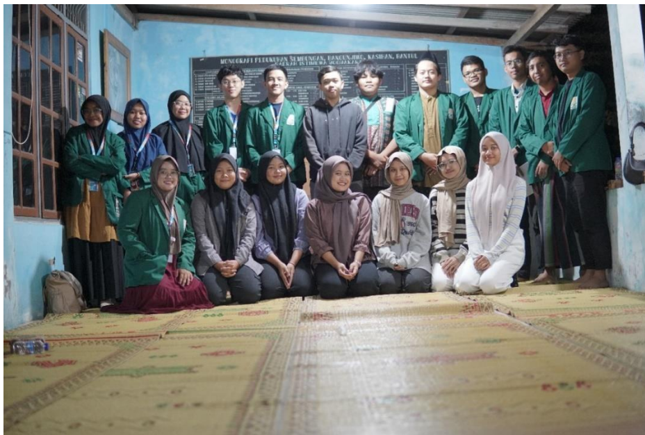
Gambar 11. Pertemuan Dengan Karang Taruna Dukuh Sembungan