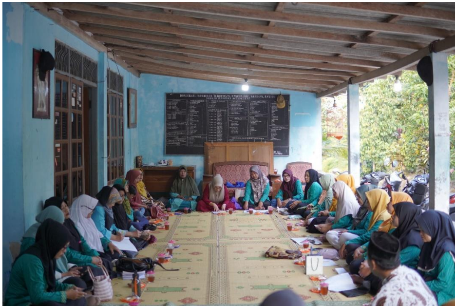
Gambar 10. Pertemuan Dengan Ibu PKK Dukuh Sembungan