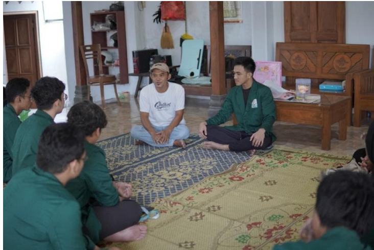
Gambar 4. Pertemuan Dengan Ketua Jaga Warga Dukuh Sembungan