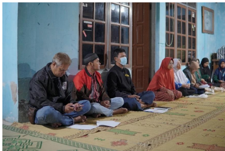
Gambar 3. Pertemuan Dengan Ketua LPMK Dukuh Sembungan