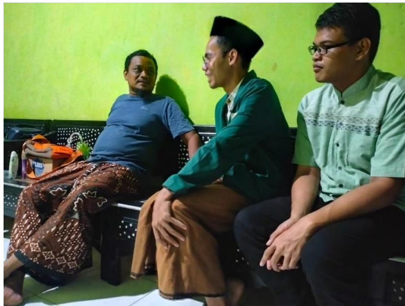
Gambar 8. Pertemuan Dengan Ketua RT 04 Dukuh Sembungan