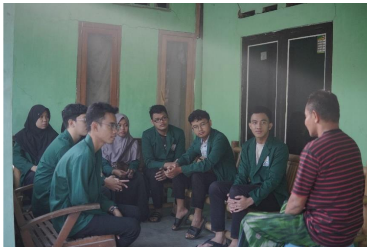
Gambar 5. Pertemuan Dengan Ketua RT 01 Dukuh Sembungan