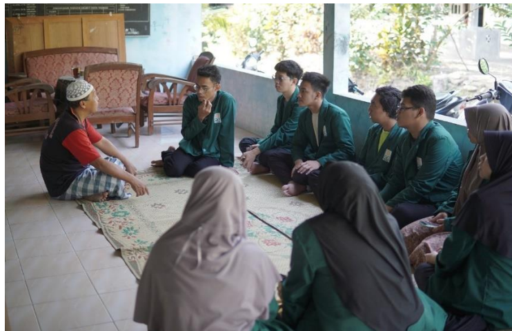
Gambar 2. Pertemuan Dengan Kepala Dukuh Sembungan