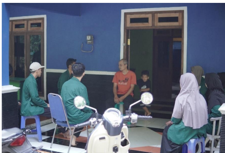
Gambar 6. Pertemuan Dengan Ketua RT 02 Dukuh Sembungan