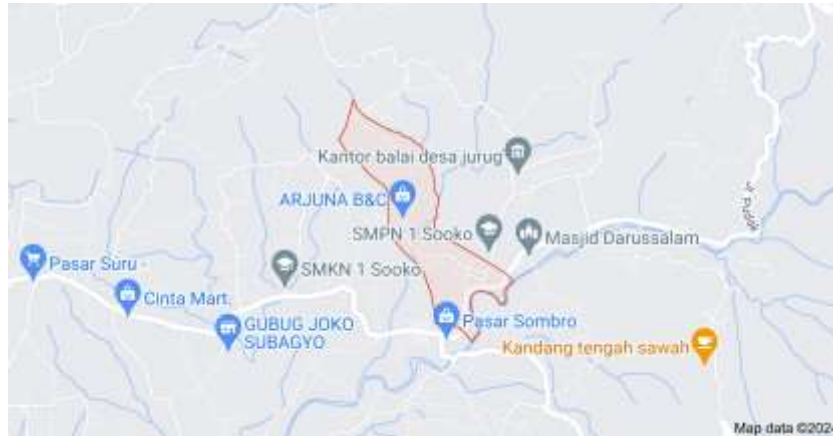
Gambar 2 Peta Wilayah Dusun Dalangan