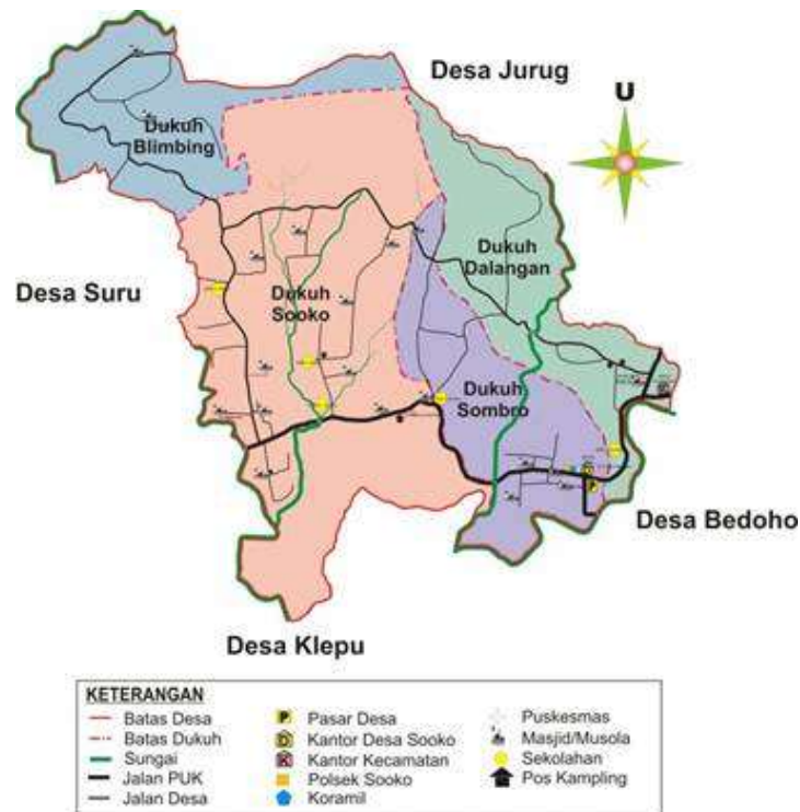
Gambar 1 Peta Wilayah Desa Sooko

Dukuh Dalangan berada disebelah timur wilayah desa Sooko kecamatan Sooko Kabupaten Ponorogo, Jawa Timur. Dukuh ini berbatasan langsung dengan Desa Jurug. Dukuh ini memiliki potensi hasil pertanian dan perdagangan. Wilayahnya merupakan kategori kawasan pegunungan. Dengan ketinggian kurang lebih 450 m diatas permukaan laut, membuat udara diwilayah dukuh ini sangatlah sejuk.