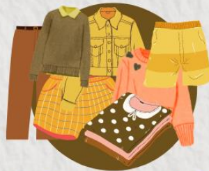
Baju layak pakai