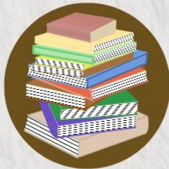
Buku layak baca