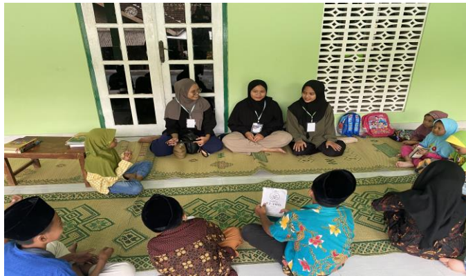
e) Kegiatan Bimbel