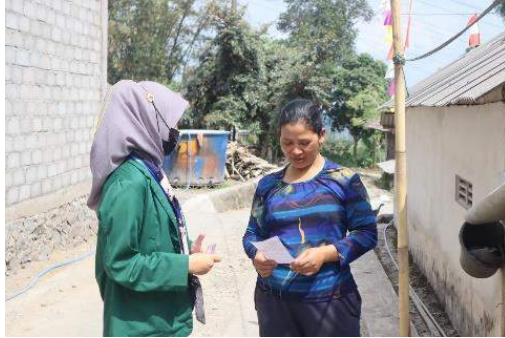
3. Pelatihan Kewirausahaan