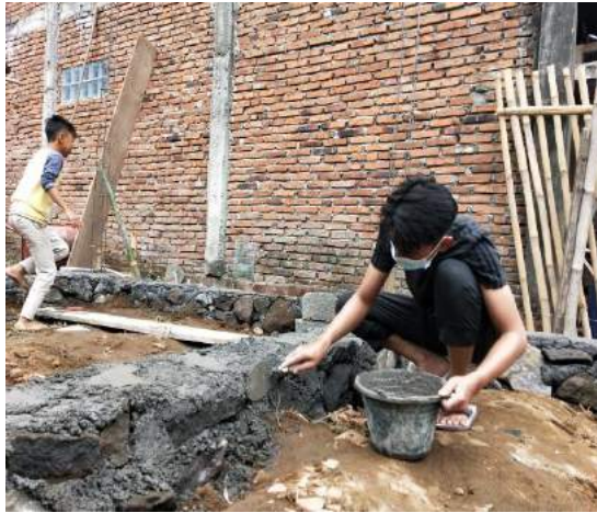
16. Pengadaan fasilitas umum untuk membaca