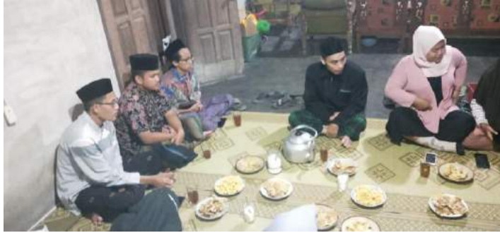
15. Kegiatan (Sambatan)