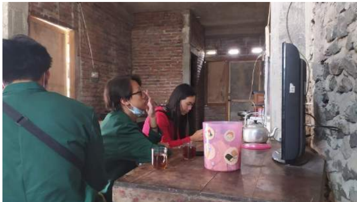
4. Bank sampah