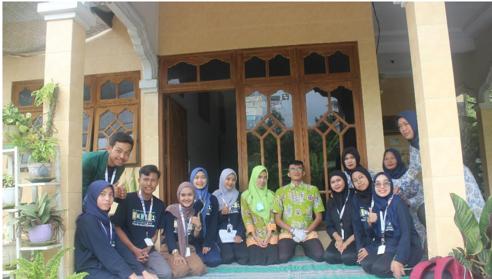
Gambar 9 Berpartisipasi Dalam Kegiatan Posyandu Lansia