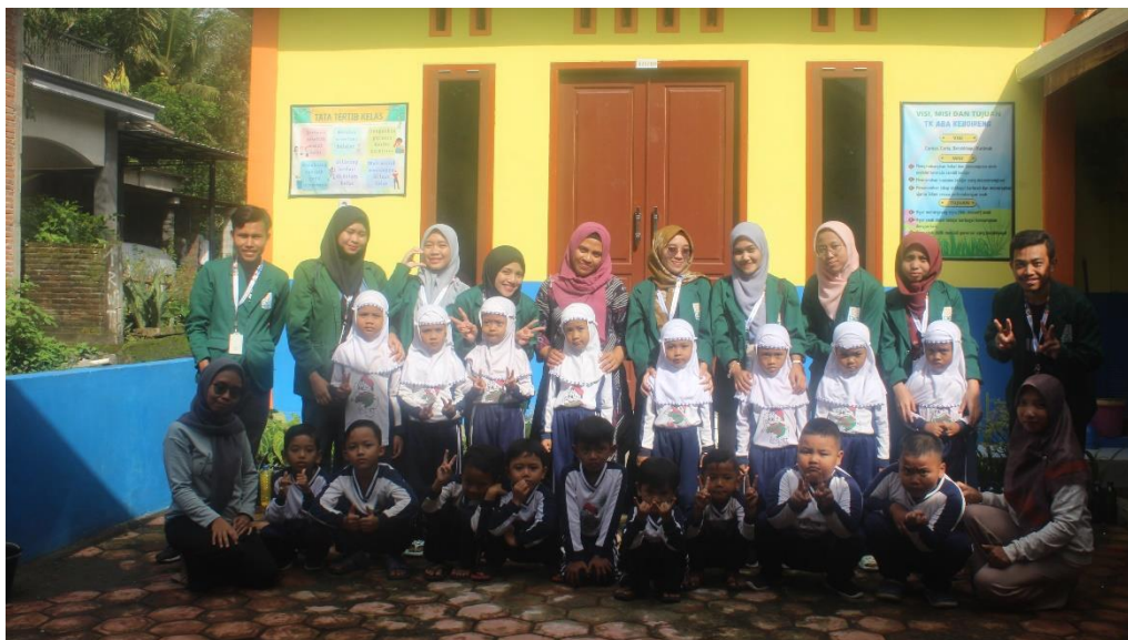
Gambar 10 Berpartisipasi Dalam Proses KBM TK ABA Keboireng