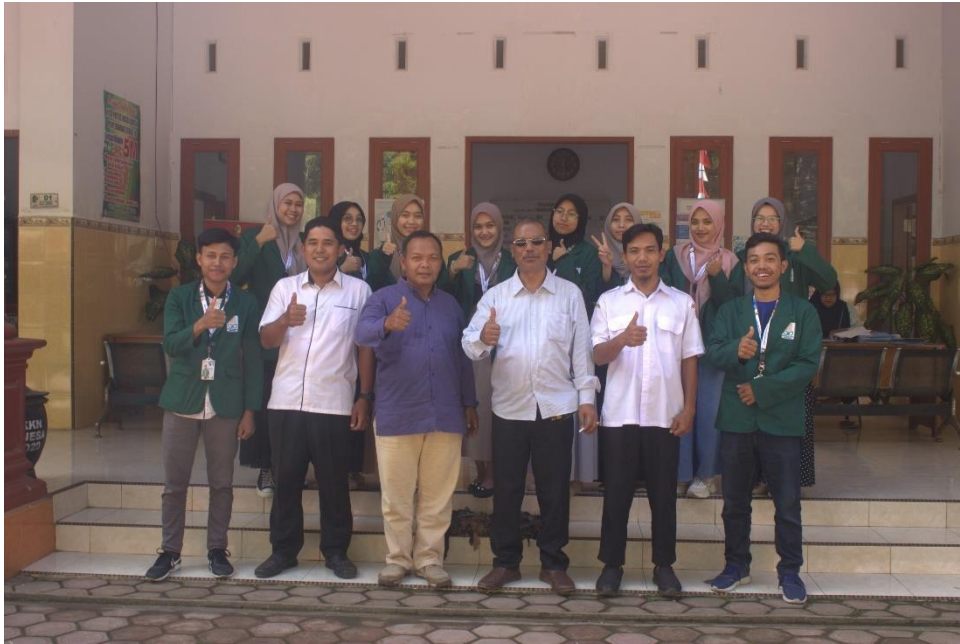
Gambar 3 Silaturahmi Dengan Kepala Desa