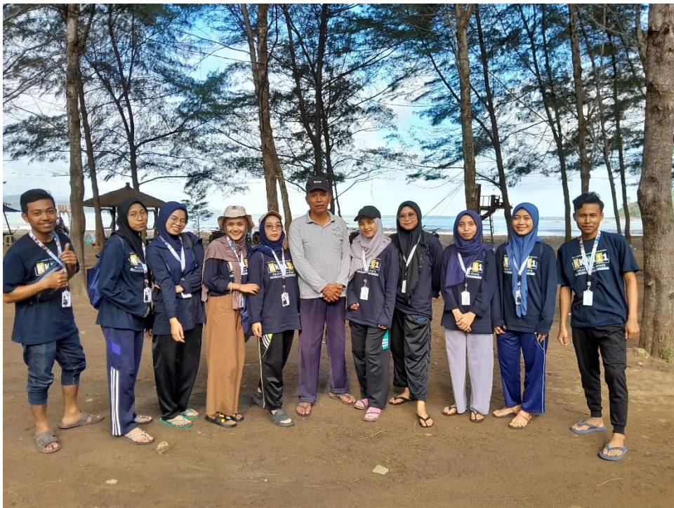
Gambar 4 Survey Wisata Pantai Gemah