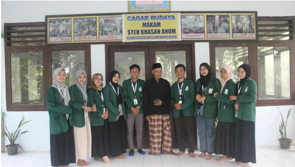
Gambar 7 Survey Petilasan Makam Syeikh Khasan Anom