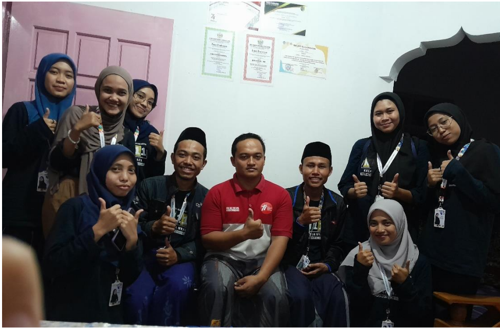
Gambar 5 Silahurrahi Dengan Ketua Karang Taruna