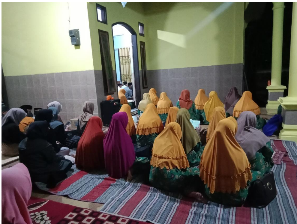
Gambar 8 Berpartisipasi Dalam Melestarikan Tradisi Lokal