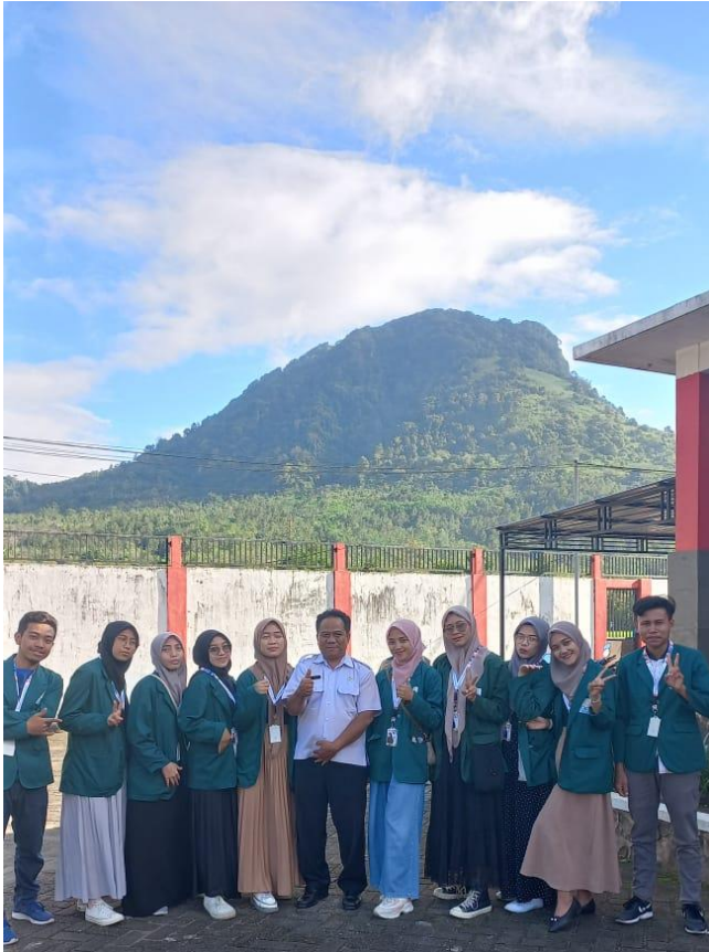
Gambar 1 Silaturahmi Dengan Kepala Kecamatan