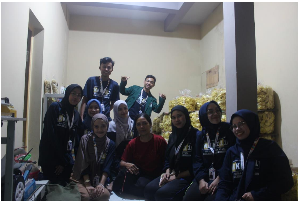
Gambar 6 Survey UMKM di Desa Keboireng