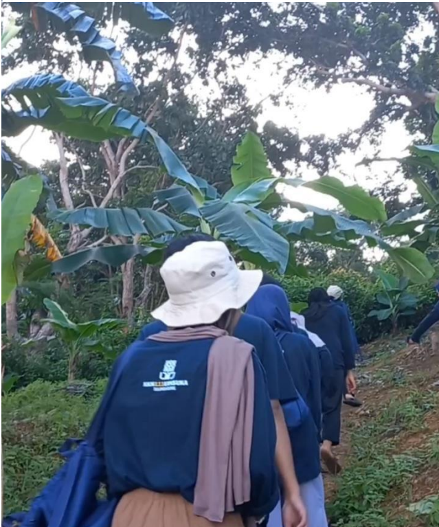
Gambar 2 Survey Kebun Pisang